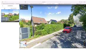
Skærbillede 2022-01-27 kl. 15.22.50 (2)