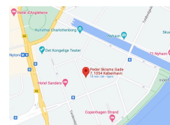
Peder skrams gade